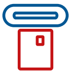
Patientenanlage per eGK